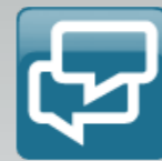
Splash Screen für iOS

Lösung: Form follows function pur: Nach dem Funktionsdesign folgte das Interaction Design, auf dem in Zukunft jedes Kundenbranding mit den vom Kunden gewünschten Funktionen aus dem Baukasten und in seinem CI/CD aufbauen sollte. Entscheidend bei der Entwicklung des „White Label“ Grunddesigns war eine minimale Anzahl von Screens bei maximaler Flexibilität, die die komplexe Funktionalität – von Telefonie, SMS, Video Call, Group Chats, Adress Book bis Werbebanner – abzubilden in der Lage waren. Alles wurde für iOS und Android geräteübergreifend und User Experience optimiert bis ins letzte Detail geplant, designt und realisiert. Konzeption, Screen Design, UX und Interaction Design, Steuerung der Programmiererteams etc. erfolgten agil und state-of-the-art.